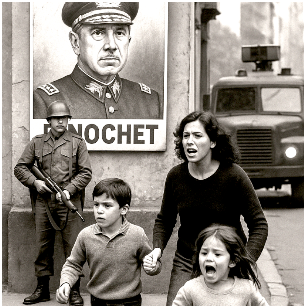
Imagen creada con ChatGPT a partir de texto descriptivo. Imagen de memoria autobiográfica de Brisa MP reproducida por la IA. Imagen creada por Chat GPT días previos a este discusión máquina-persona entorno a la generación de imagen política con presencia de niños.

Bri### a partir de esta imagen creada por ti, genera una imagen nueva dando continuidad a esta imagen a modo de relato. Mantén a los 3 personajes centrales , el concepto y la estética.